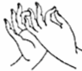
Dharmachakra Mise en mouvement de la roue de la loi