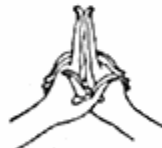
Uttarabodhi Détachement complet